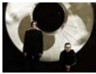
anbb / Alva Noto + Blixa Bargeld